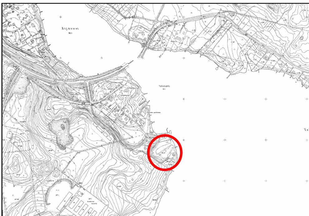
Kuva 1: Kaava-alueen sijainti

Kunta on myynyt alueen ja ostaja on hakenut kaavanuutosta.