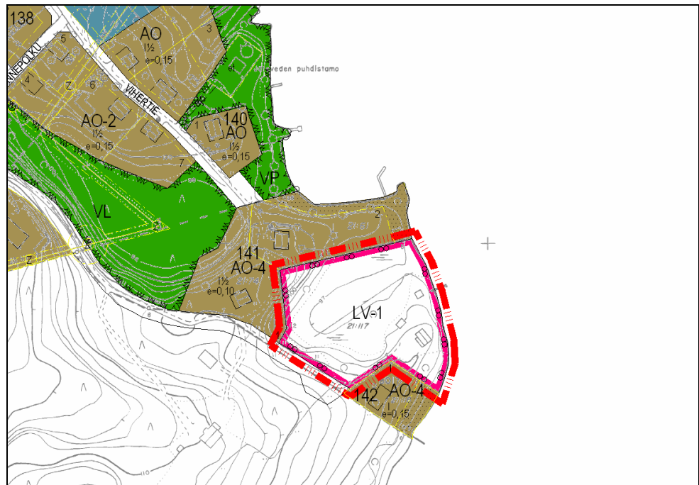
Kuva 3: Kaava-alueen likimääräinen rajaus ja ajantasakaava.

Voimassa olevassa kirkonkylän asemakaavassa tila on LV-aluetta (kuva 3).