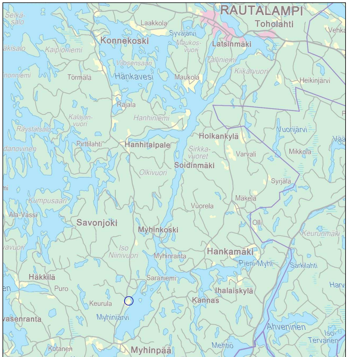
KUVA 1: Kaava-alueen sijainti

Ranta-asemakaava-alue sijaitsee Rautalammin kunnassa Myhinjärven läntisellä ranta-alueella.