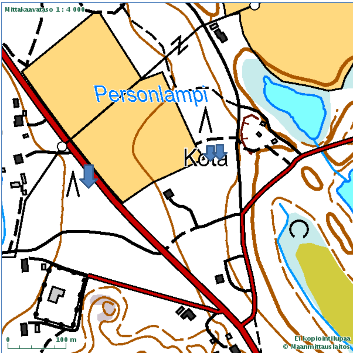
Kartta 2: Rautalampi, Personlampi kuoppakohde