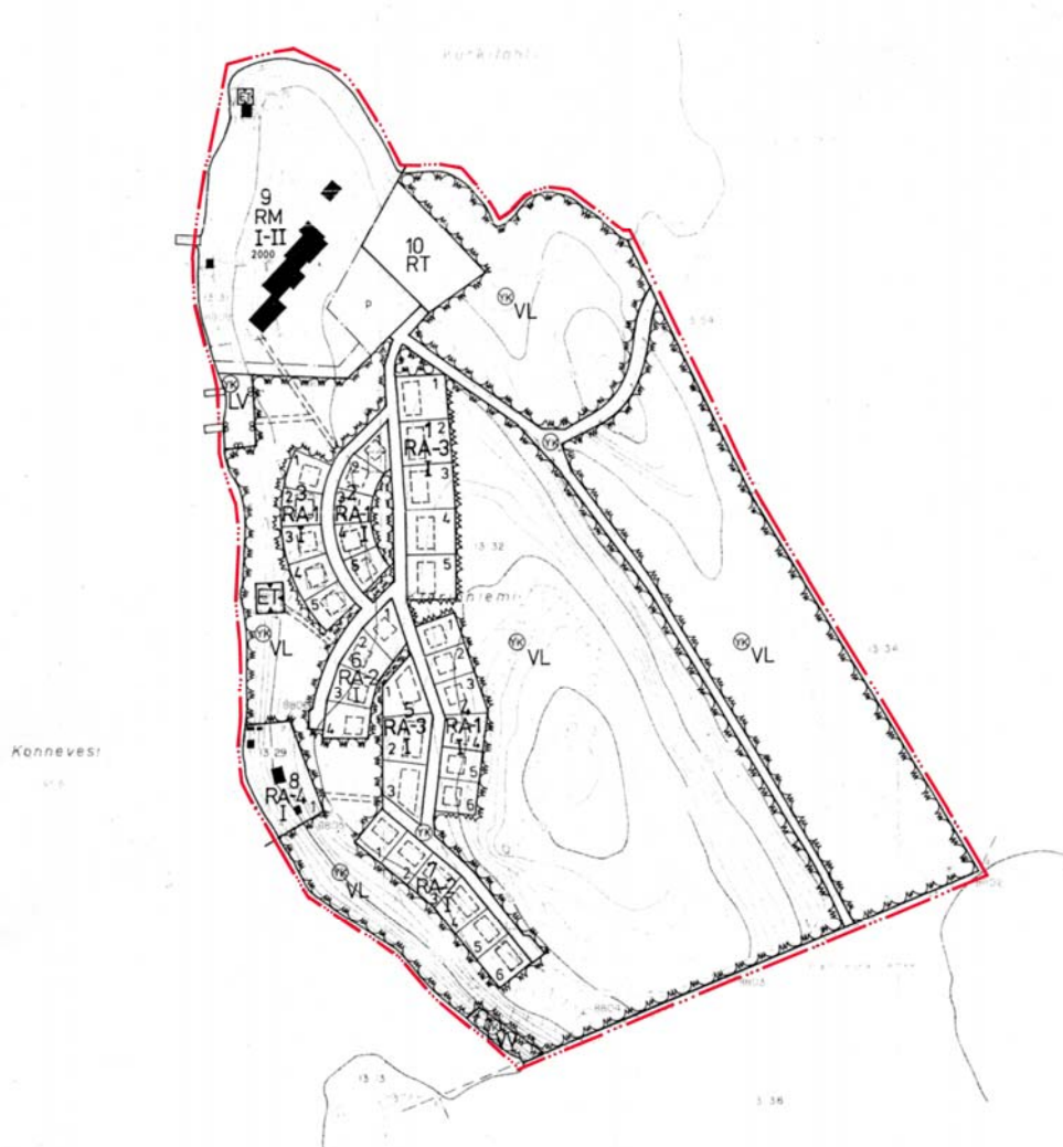
Kartta 2. Ote voimassa olevasta Kierinniemen rantakaavasta.

Ranta-asetmakaavan muutos koskee tiloja Rn:o 13:89 (Hoivakoti Tikkanen); Rn:o 13:29 (Raija Hakala); Rn:o 13:65 (McCann); Rn:ot 13:73, 13:74, 13:75, 13:76, 13:77, 13:78, 13:79, 13:80, 13:81, 13:82, 13:83, 13:84, 13:85, 13:86, 13:87, 13:88, (Patinki Oy); Rn:o 13:60, 13:61, 13:62, 13:63, 13:64 (Konneveden Osuuspankki); Rn:o 13:66, 13:90 (Rautalammin kunta) Kierinniemiessä Rautalammin kunnassa. Tarkastelualue on rajattu punaisella viivalla (kartta 2).